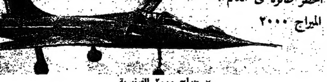
ميراج ٢٠٠٠ الفرنسية

الهجوم على مواقع ارضية ، كانت قد اصحت الميبل الثاني لهذا النوع من الطائرات الفرنسية في عام ١٩٦٨ ، اما اسرائيل في حينه تلك ٢٦ طائرة من جنوب افريقيا فكانت من امثلة طائرات هذا النوع لثمان وخمسين طائرة . اما ليبيا فقد اشترت تسعة بعد ١١٠